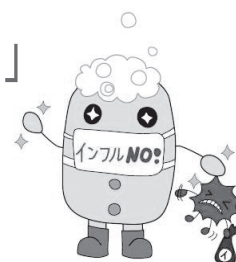
インフルエンザ対策マスコットキャラクター「マウテ君」

インフルエンザを予防するために、予防接種やアルコール製剤による手の消毒のほか、体の抵抗力を高めるために、生活リズムを整え、バランスの取れた食事や、十分な睡眠をとりましょう。また、普段からうがい、手洗いを心がけ、症状に応じて、マスクをするなど、せきエチケットを行いましょう！